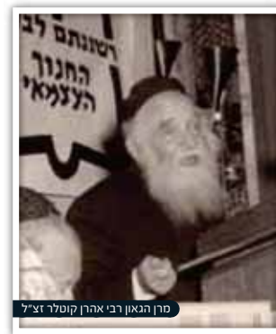
מן הגאון רבי אהרן קוטלר זצ"ל

כה התגלגלו הדברים, שאף בזמן ארוחותיו מוקף היה תמיד באנשים שבאו אליו עם בעיותיהם, ואכילתו ברוב הימים מהולה מרורים ולענה מצרותיהם של ישראל. הוא התעמק כל כך בעניינים שלהם, עד שלעיתים תכופות שכח מן האוכל לחלוטין, והיו צריכים