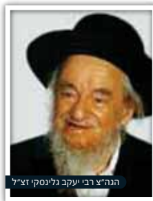
הגה"צ רבי יעקב גלינסקי זצ"ל

כולם שמעו על ה'חומרות' של ה'חזון איש' זצ"ל. אבל במפורש שמעתי מפי ה'חזון איש': "אני לא מחמיר, אלא רק מקפיד על ההלכה!" שאלתי: "מה בין חומרות לבין הקפדה על ההלכה?" חייך, וענה: "כשההלכה אומרת להחמיר, הרי זו ההלכה. כשההלכה אומרת שאפשר להקל ואדם רוצה להחמיר, זו זכותו. אבל שידע שההלכה אינה תובעת זאת, וממילא ישקול ויבחן האם אין החומרה פוגעת באדם!" והוסיף: "בוא ואספר לך: יש לי שכן עשיר. שאלתי אותו: 'היודע אתה שיש לך שכן עני מרוד?'"