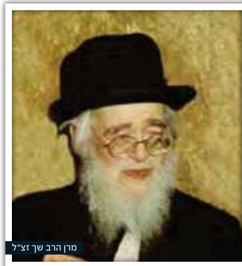
מרן הרב שך זצ"ל

והסביר: "בליל בדיקת חמץ בא אלי בחור, וראיתי שזקוק הוא לטיפול דחוף. טלפנתי אליך, אף על פי שידעתי שאתה טרוד בזמן כזה. הצעתי לבוא עם הבחור, ואתה אמרת שאין צורך, שלא אבוא, אתה מוכן לבוא לכאן.