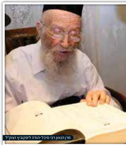
מרן הגאון רבי מיכל יהודה ליפקוביץ זצוק"ל