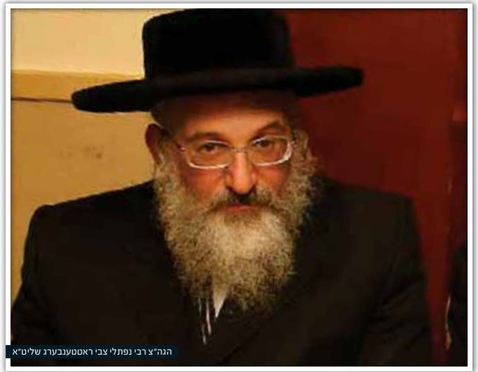
הרה"צ רבי נפתלי צבי ראטענבערגער שליט"א

המלחמה, כשהציבור התחיל לגדול ולא היה מה לאכול. לא היה ניתן להשיג מוצרי חלב כשרים בכשרות מהודרת כי המדקדקים היו עושים לבד בבית, וממש לא היה מה לאכול. הוא הנהיג אז בעדה החרדית שיתחילו לתת הכשרים על מוצרי מאכל שונים, כמו מוצרי חלב של תנובה וכדו', וכמובן שהיתה לזה התנגדות גדולה, כי בירושלים התנגדו לכל דבר חדש. אפילו להקים את שכונת 'מאה שערים' זה לא היה פשוט בירושלים של בין החומות. אבל היום יש כבר כמיליון יהודים שומרי מצוות, צריך לתת לציבור בסיס של מאכלים כשרים ומהודרים גם בימות השנה וגם בפסח, ומי שרוצה להחמיר ולהדר בביתו, תבוא עליו הברכה".