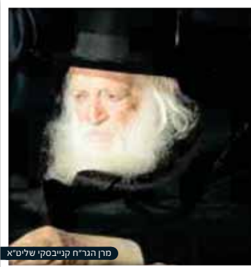
מרן הגר"ח קנייבסקי שליט"א

שיא השיאים של כל ימי השנה היה כמובן ליל הסדר. אי אפשר לתאר את שירת 'בצאת ישראל', שאבא שר שוב ושוב בדבקות עילאית. אני זוכרת היטב גם את אמירת 'שפוך חמתך'. תמיד נראתה על פניה של אמא הציפייה לראות את אליהו הנביא