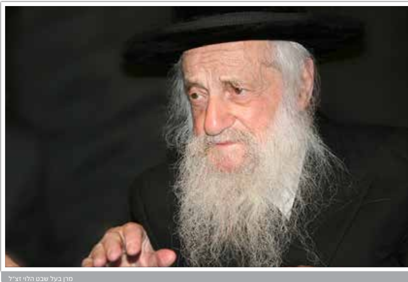
מרן בעל שבט הלוי זצ"ל

רבינו חיך, הרחר מעט ואמר: "אלו שתי דרכים בהן אפשר להתעלות. ברוב העיירות שיהודים חיו לפני המלחמה, דווקא העניות הקשה הרחיקה מתפנוקי עולם הזה, העניקה ברען של מסירות נפש ודחף להתגבר על מדוחי היצר. חז"ל בילקוט (רות א,