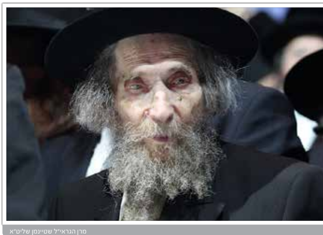
מרן הגראי"ל שטיינמן שליט"א

לבוהן לכבות ביום דין... שמעתי מרבינו שאומר בדאגה, שמקווה שבעולם האמת לא יהיו בושות לאביו, בכך שלא היה כפי שציפה שיהיה. לעתיד, ישאלו את האדם: "ערוך מקרא שקרית ומשנה ששנית", וזה