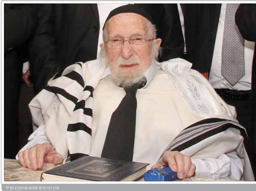
מרן רבי חיים פנחס שיינברג זצ"ל

של ה"אני לדודי". בליל ראש השנה, לפני תפילת ערבית, היה מוסר שיחה. לאחר מכן, היה עובר לפני התיבה בהשתפכות הנפש וברגש רב. משהסתיימה התפילה, התייצב לברך ולהתברך בברכת "לשנה טובה" למאות בני הישיבה ומתפלליה, ועוד רבים שהגיעו להתברך מפיו, במשך שעה ארוכה. בבוקר השכים לקום כמה שעות לפני עלות השחר, והיה הולך ברגל לכותל המערבי וחוזר לחזרת הש"ץ של שחרית בישיבה, בה עבר לפני העמוד. משנת