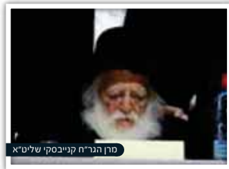
מרן הגר"ח קנייבסקי שליט"א

עוד נשאל מרן שר התורה, הגר"ח קנייבסקי שליט"א, במי שמרגיש כי יצליח להשקיע יותר בסדרי לימודיו הקבועים בגמרא רק אם לא יפריש מזמנו ללימוד ההלכה, האם חייב בקביעות עתים להלכה, והשיב: "בודאי".