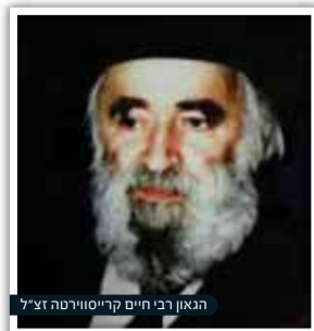
הגאון רבי חיים קרייסווירטה זצ"ל

כשנכנס למעון קודשו, בדיוק נטל הח"ח את ידיו לסעודה. בתחילת הסעודה אמר "מזמור לדוד ה' רועי לא אחסר" תוך שהוא מטעים