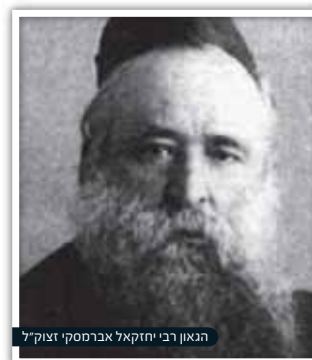
הגאון רבי יחזקאל אברמסקי זצוק"ל

הרב אברמסקי החל לרצות את עונשו, לאחר כמה ימים התחילו