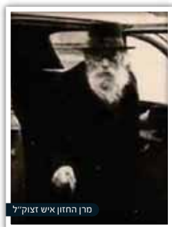
פרן החזון איש זצוק"ל

לפחות חמש עשרה טלפונים במשך כשעת לימוד אחת ור' אברהם השיב באותו טון באותו נוסח והצעת סיוע "האם אני יכול לסייע לכם משהו? אני אומר לה מיד כאשר תקום" - כמו תקליט חוזר. לא ניסה לנתק את הקו או לומר לה "הרי כבר אמרתי לכם" ובסיום הטלפון שב לתלמודו מתוך רוגע. (מפי תלמיד חכם שלמד איתו בקביעות אחרי ותיקין).