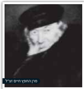
מֶרֶן הַחֶפֶץ חַיִּים זְצ"ל

סיים רבי אלהנן את הספדו: "עבד ה', עבד אמיתי, כולל בתוכו הכל! הוא קנוי לאדונו ועושה רצונו והוא שייך לו. זו היתה מציאותו של רבינו החפץ חיים זצ"ל, בכל לבבו, נפשו ומאודו עבד את בוראו וכל מעשהו עלי אדמות - לקדש שם שמים".