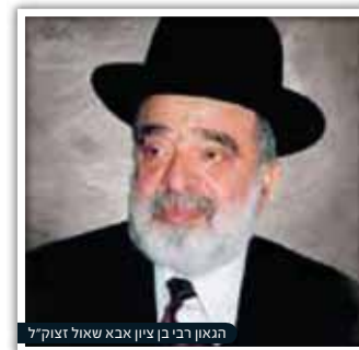
הגאון רבי בן ציון אבא שאול זצוק"ל