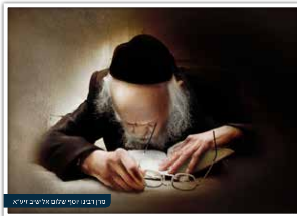
מרן רבינו יוסף שלום אלישיב זיע"א

באחד הימים באתי אל הקודש פנימה יחד עם אחד מגדולי מחזיקי התורה שבחו"ל, שחפץ היה ליהנות מזיוו של רבנו ולזכות לראות את הדרת פניו. אותו מחזיק תורה התפרנס ממכירת שעונים יוקרתיים מסוגים שונים, שהניבו