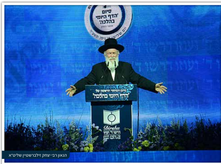
הגאון רבי יצחק זילברשטיין שליט"א

אם ננסה לתרגם את הדברים בלשונו, אמר הרב שליט"א, נוכל לצייר ולומר שאם האדם היה צריך להעביר חבילה כלשהי לשיבת ליקוואד באמריקה, כל מה שהיה עליו לעשות הוא להגיע לחוף הים, בחיפה, ביפו, בתל אביב, באשדוד, או בכל מקום אחר, ולצוות על אחד הדגים הגדולים שיעמים על גבו את החבילה וישאנה לליקוואד... והדג היה משועבד