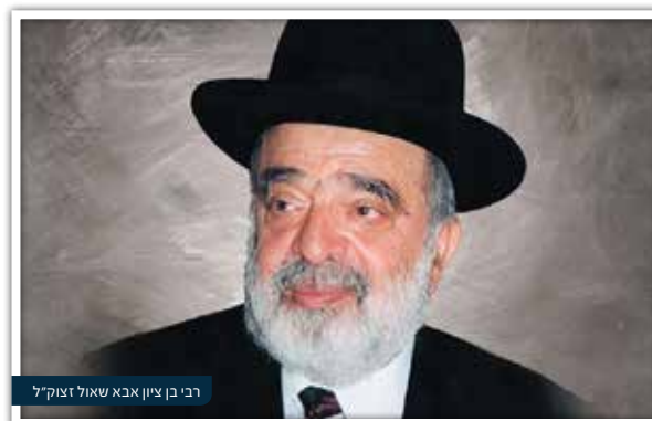
רבי בן ציון אבא שאול זצוק"ל