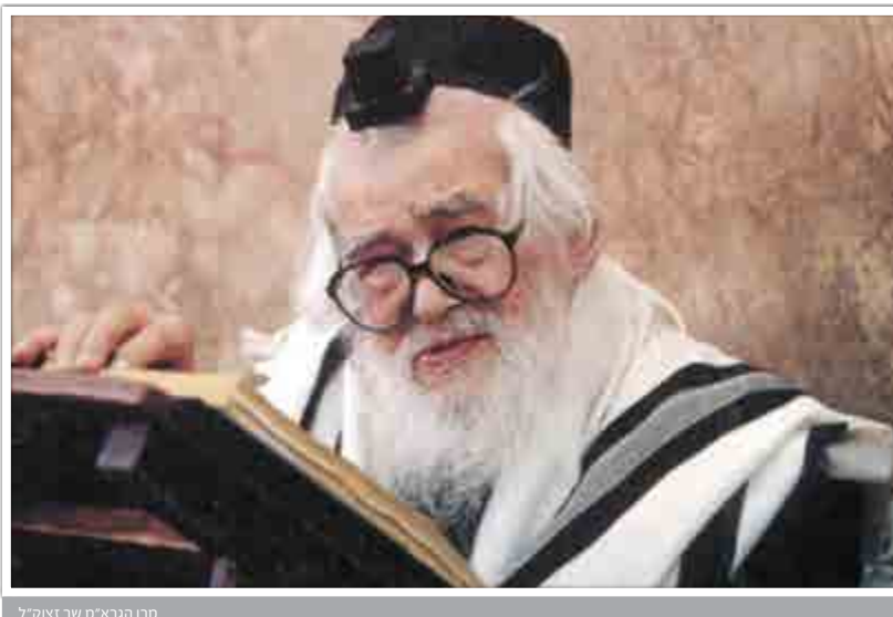
מרן הגרא"מ שך זצוק"ל

'שלוש שעות ומחצה! איזו פגישה יכולה להעסיק את רבינו זמן רב כל כך?' - תהה בליבו, אולם כמובן, לא אמר מאומה. ככל שהתארך הזמן, הצטרפו אנשים נוספים אל הממתנינים. בשלב מסוים אף הופיעו שניים מחסידיו של אחד מגדולי האדמו"רים והודיעו