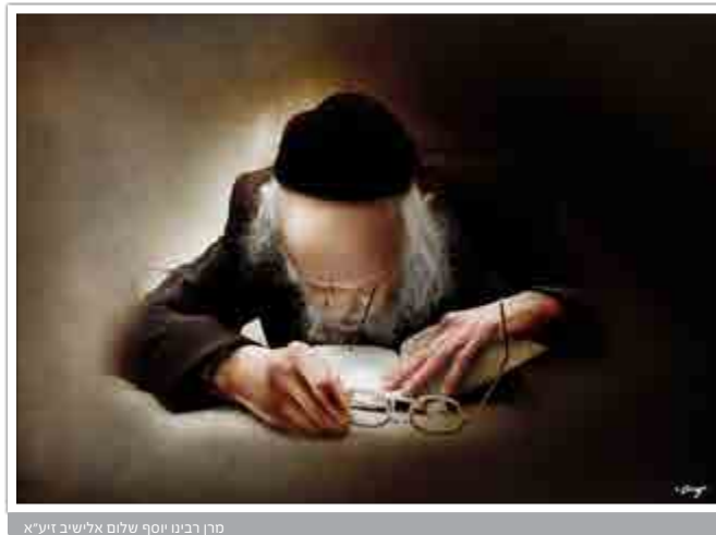
מרן רבינו יוסף שלום אלישיב זיע"א

וכך סיפר הגאון רבי יעקב אדלשטיין שליט"א: היתה זו שעת לילה מאוחרת. עליתי ירושלימה, הגעתי לביתו של רבינו והמתנתי לשעה 2:30, זמן תחילת הסדר. עמדתי בחדר השני ושמעתי את רבינו קם משנתו, נוטל ידיו ומיד