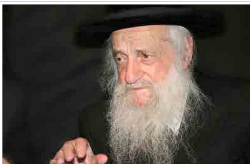
בעל 'שבט הלוי' זצ"ל

רבינו הסביר: "נכון שיש ענין שבפעם הראשונה שהילד מניח תפילין, הוא יעשה זאת על ידי רב, אבל האם חשבת, אבא יקה, כמה דברים לא טובים עלול הילד שלך לראות במהלך הדרך הארוכה שתעשה איתו מאמריקה עד לארץ ישראל? וכי הצר שווה בנזק המלך?" האב ההמום ניסה להסביר כי הילד עלול להתאכזב בצורה קשה, "שום דבר שבעולם אינו שווה שיקריבו עליו את